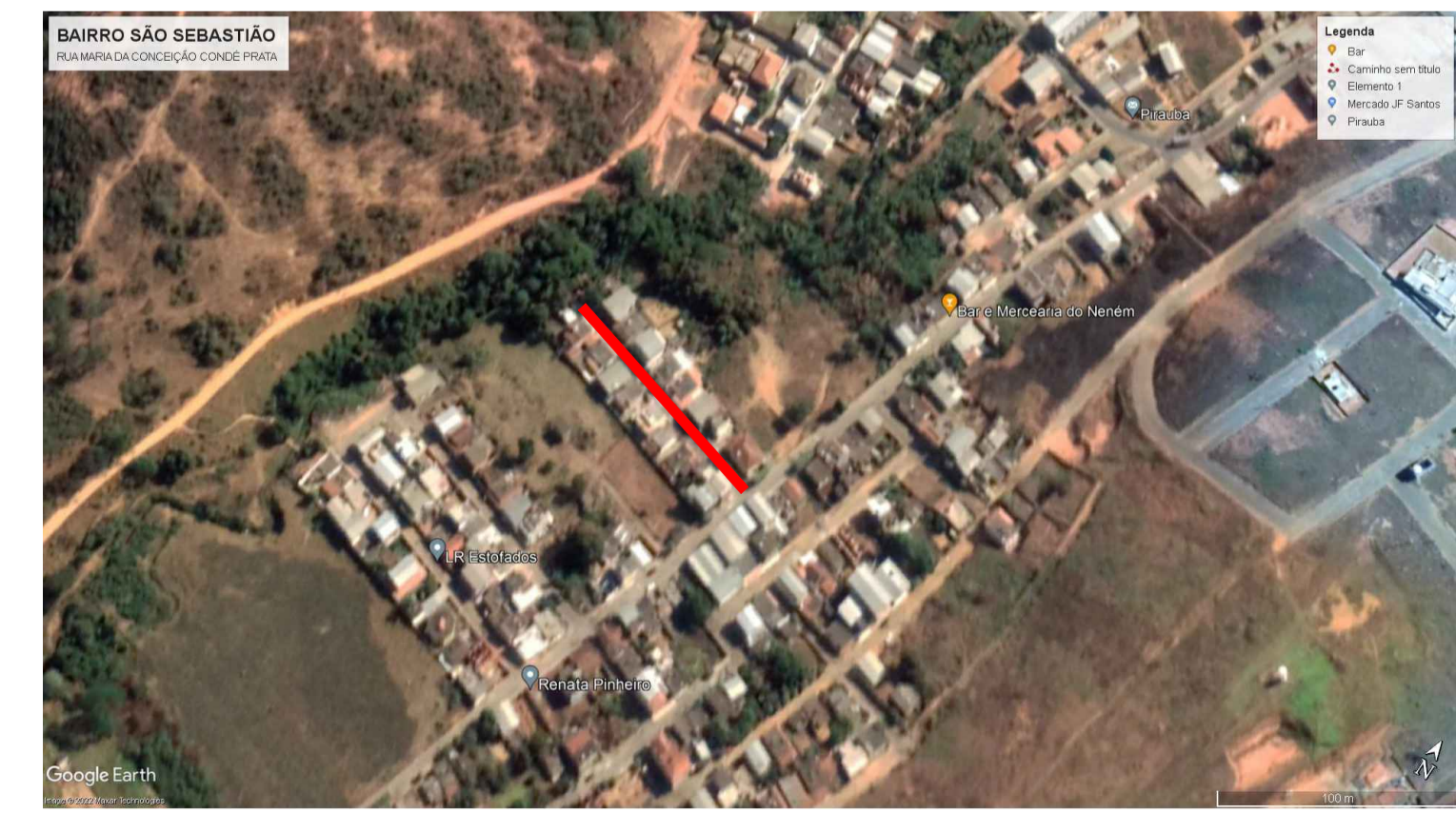
LOCALIZAÇÃO – BAIRRO SÃO SEBASTIÃO – RUA MARIA CONCEIÇÃO CONDÉ PRATA S/ESCALA