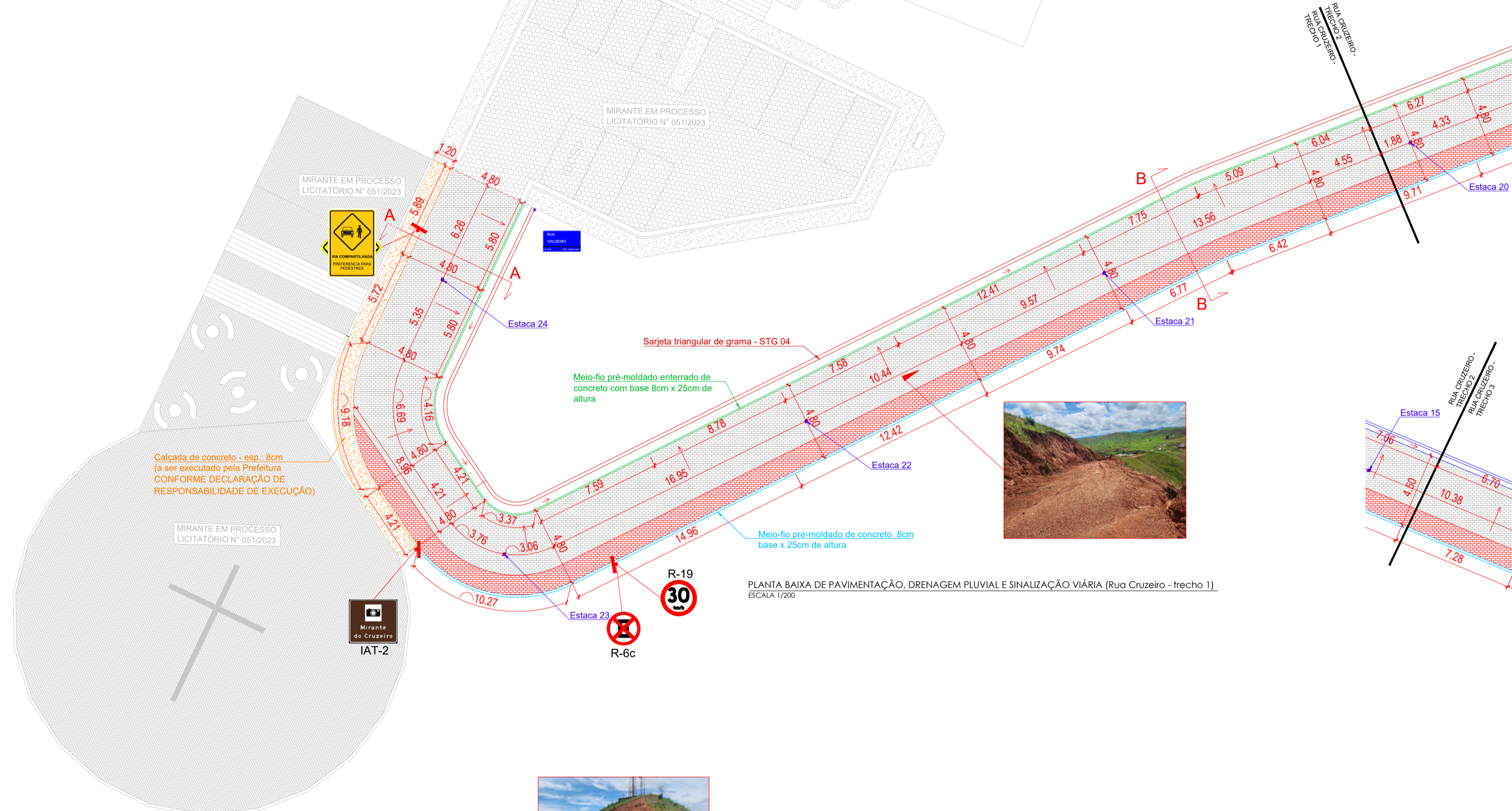
PLANTA BAIXA DE PAVIMENTAÇÃO, DRENAGEM PLUVIAL E SINALIZAÇÃO VIÁRIA (Rua Cruzeiro - trecho 1) ESCALA 1/200